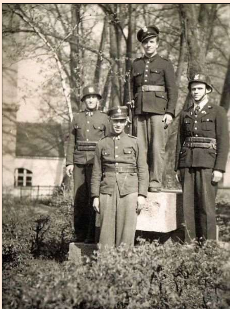
Strażnicy młyna pozują do fotografii przy postumencie usuniętego pomnika wojennego, lata 40. XX w.