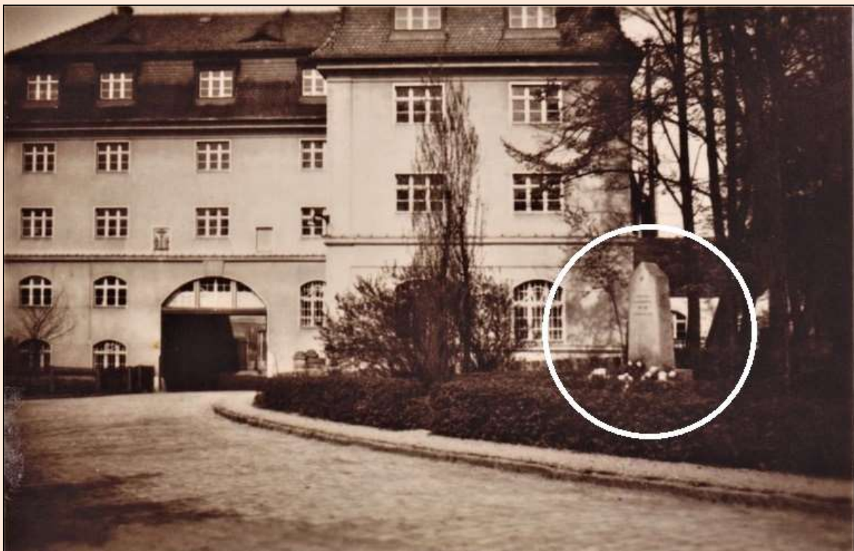
Pomnik wojenny (tzw. Kriegerdenkmal) obok młyna. Fotografia z 1934 r.

Po wojnie społeczność Śmiałowic wystawiła nieopodal młyna pomnik wojenny (tzw. Kriegerdenkmal). Monument ów miał formę granitowego, czworobocznego obelisku ustawionego na niskim prostopadłościennym postumencie. Na jego frontowej płaszczyźnie widniały nazwiska poległych podczas wojny mieszkańców Śmiałowic. Pomnik ten został przewrócony w latach 40. XX w., a ostatecznie usunięty wraz z budową młynskiej wagi. Wedle relacji mieszkańców, obelisk pomnika przez okres ok. 20 lat leżał za remizą strażacką, a później w zaroślach nad brzegiem młynówki. Jego dalsze losy pozostają nieznane.